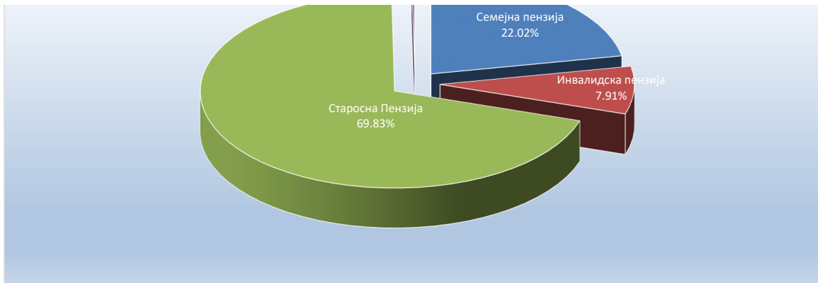
Состојба на корисници на пензија по групи на исплати за јануари 2024 г.